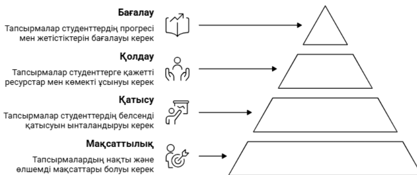
2-сурет. Тапсырмаларды құрастырудың негізгі принциптері

Зерттеуге бағдарланған оқыту «Inquiry-Based Learning» сабақ құрылымы бірнеше өзара байланысты кезеңдерден тұрады (Кесте 3).