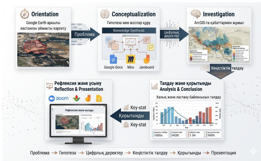
3-сурет. Цифрлық платформалармен интеграцияланған зерттеуге негізделген оқыту моделі

Цифрлық платформалармен біріктірілген «Inquiry-Based Learning» моделі зерттеу әрекетін заманауи цифрлық ортада ұйымдастыруға мүмкіндік береді. Бұл тәсілде inquiry кезеңдері (бағдарлау, мәселені тұжырымдау, зерттеу, талдау, қорытынды жасау) кеңістіктік деректермен, визуалды аналитикамен және онлайн бірлескен құралдармен ұштастырылады. Нәтижесінде оқушылар тек теориялық білім алып қана қоймай, нақты деректермен жұмыс істеу арқылы зерттеу, талдау және цифрлық құзыреттіліктерін кешенді түрде дамытады (Сурет 3).