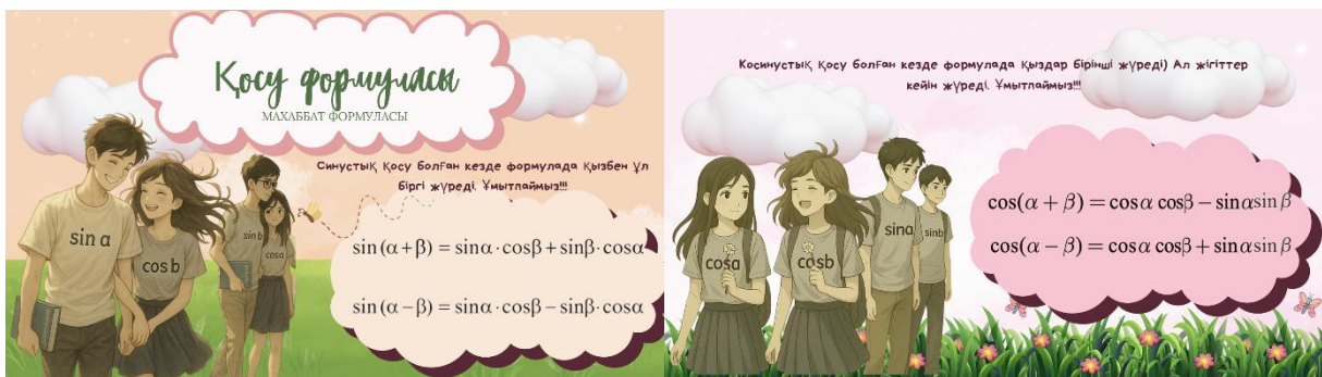
3-сурет. Қосу формуласы бойынша визуалды мнемотехникалық сурет

Мысалға: қосу формуласын жаттауда қиналатын оқушылар үшін ертегі-комикс форматында фотоларды ұсынуға болады (3-сурет)