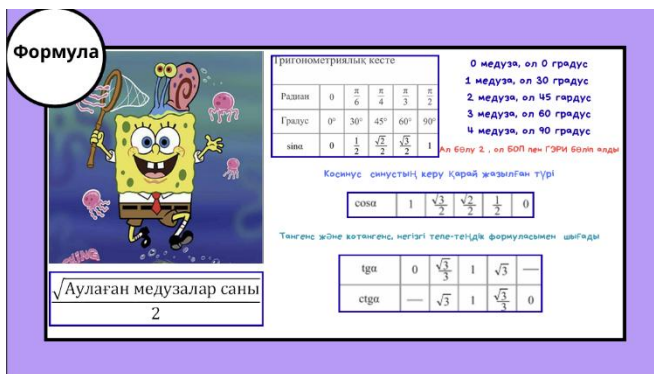
4-сурет. Тригонометриялық градустарды оңай жаттау әдісінің бірі

Тригонометриялық градустарды жаттауды оңай ету үшін де осындай ЖИ көмегімен суретті ұсындым, ол әдіс мультфильм форматында, оқушылардың есте сақтауына көмек береді. «Қол ережесі» секілді жақсы әдіс (4-сурет)